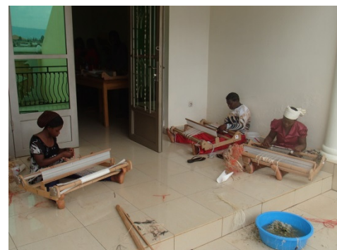
A scene from the banana fiber weaving training / バナナ繊維織物研修の一場面