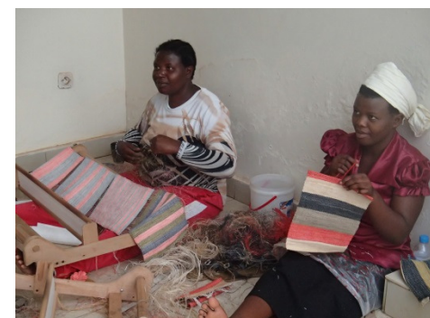
Pilot products made during the banana fiber weaving training / バナナ繊維織物の研修中に制作された試作品