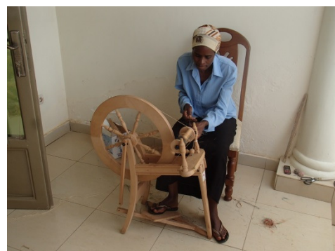
Making yarn during the banana fiber weaving training / バナナ繊維織物研修中の糸作り