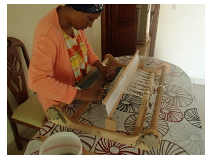
A scene from the banana fiber weaving training / バナナ繊維織物研修の一場面