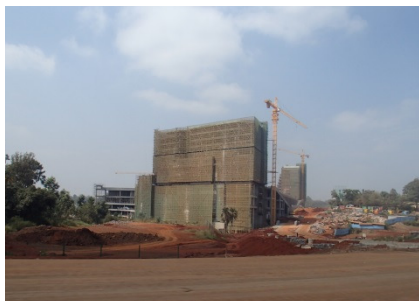
Shopping mall under construction in Nairobi, Kenya. This is going to be the biggest in the East African Community (EAC) / ケニアのナイロビで建設中のショッピング・モール。東アフリカ共同体 (EAC) で最大となる見込み

そのため、外国の開発支援者の関与は、私も含めてですが、支援が本当に必要な場合で、その支援で押す方向が「良好な発展」の範囲内であることに十分自信をもてる時に限られるべきでしょう。