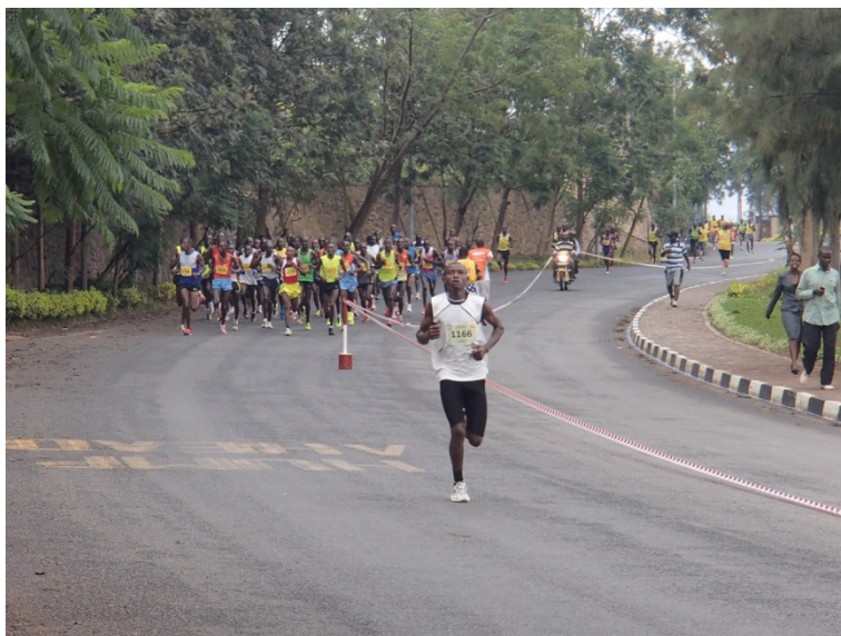
The peace marathon has become a regular annual event in Kigali. So far, the prize money is always received by Kenyan runners

平和記念マラソンはキガリの毎年の恒例行事になりました。今のところ、賞金はいつもケニアの選手にもっていかれています