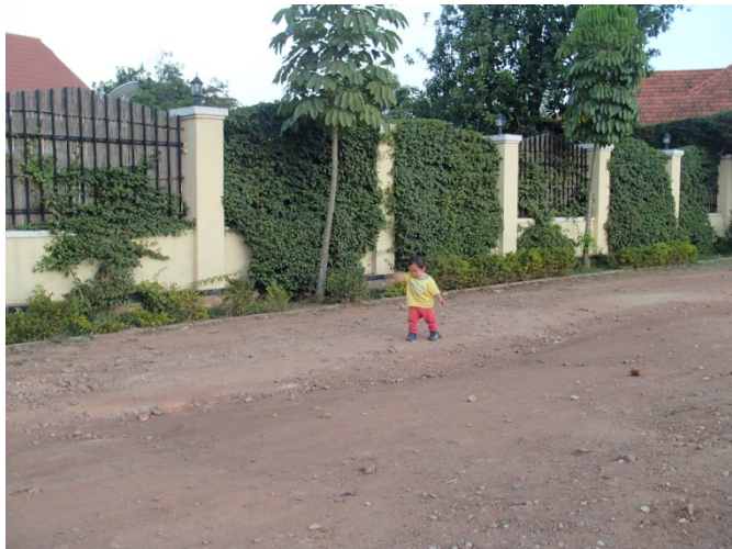
Shota: trying a stone shot-putting