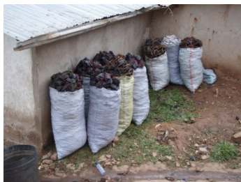
Typical charcoal sacks in Rwanda

見本がルワンダに届くのは、まだ先の7月かそれ以降ではありますが、私の提案がついに実現されるかもしれないのはとてもうれしいことです。ルワンダの危険で急な曲がり角での交通事故の犠牲者数が、反射鏡によって減ることを願います。