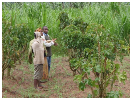
ニャビフ郡に植えられたジャトロファ。おそらく寒さのため、種子の生産性が低い