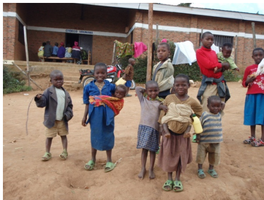
According to one book I recently read, it was also common in Japan in the past that young children carried babies (younger siblings) on their backs

開発中の有機ゴミから作った調理用燃料：煙の排出が抑えられており室内汚染を減らすと期待されている