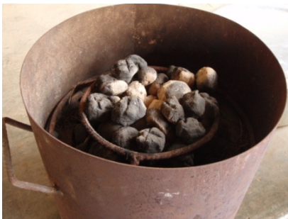
Cooking fuel from organic waste under development: smoke emission is minimized and it is expected to reduce in-house pollution

開発中の有機ゴミから作った調理用燃料：煙の排出が抑えられており室内汚染を減らすと期待されている