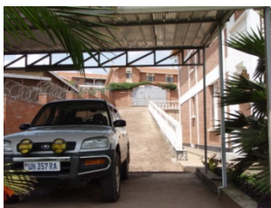
Our first car in Rwanda ルワンダの我々の最初の車

20分くらいすぎると、彼らはドアを開けてくれました。今は自分でもどうやって開ければいいか分かります。作業料はかなり高めでしたが（具体的な値段は忘れましたが）、アフリカらしい経験は楽しめました。