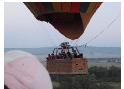
Jan – Balloon safari (Kenya) 1月 – 気球サファリ(ケニア)

2010 seems to become a 'year of waste' for me. The top priority is to be able to continue my daily efforts without facing any serious problems such as suffering from sickness and injuries.