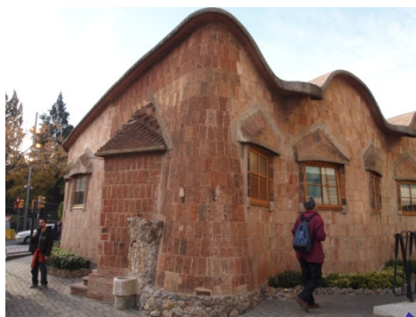
Dec – School designed by Gaudi for Sagrada Familia Church's construction workers' kids (Spain). I am proposing to a UNICEF school building designer in Rwanda to try to build such a school in Rwanda.

12月 – ガウディによってデザインされた、サグラダ・ファミリア教会の建設労働者の子供用の校舎(スペイン)。ルワンダにいるユニセフの校舎設計者にルワンダでこんな学校を作れないか相談中。