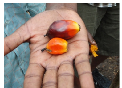
April – Palm fruits (Burundi) 4月 – ヤシの実(ブルンジ)