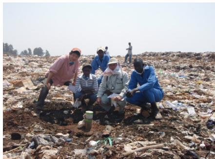
July – Measuring methane gas at Nyanza site 7月 – ニャンザ処分場でメタン・ガスの測定