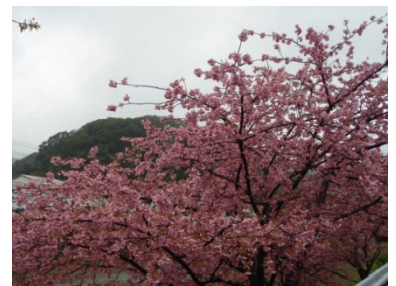
Feb – Early cherry blossoms (Japan) 2月 – 早咲き河津桜(日本・伊豆)