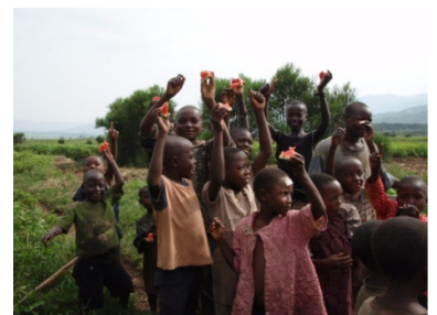
March – Water melons tasting with local kids 3月 – 地元の子供達とスイカ試食