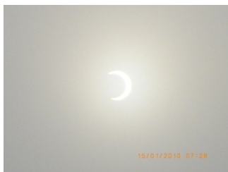
Jan. 15, 2010 – Solar eclipse 2010年1月15日 – 日食

12月 – ガウディによってデザインされた、サグラダ・ファミリア教会の建設労働者の子供用の校舎(スペイン)。ルワンダにいるユニセフの校舎設計者にルワンダでこんな学校を作れないか相談中。